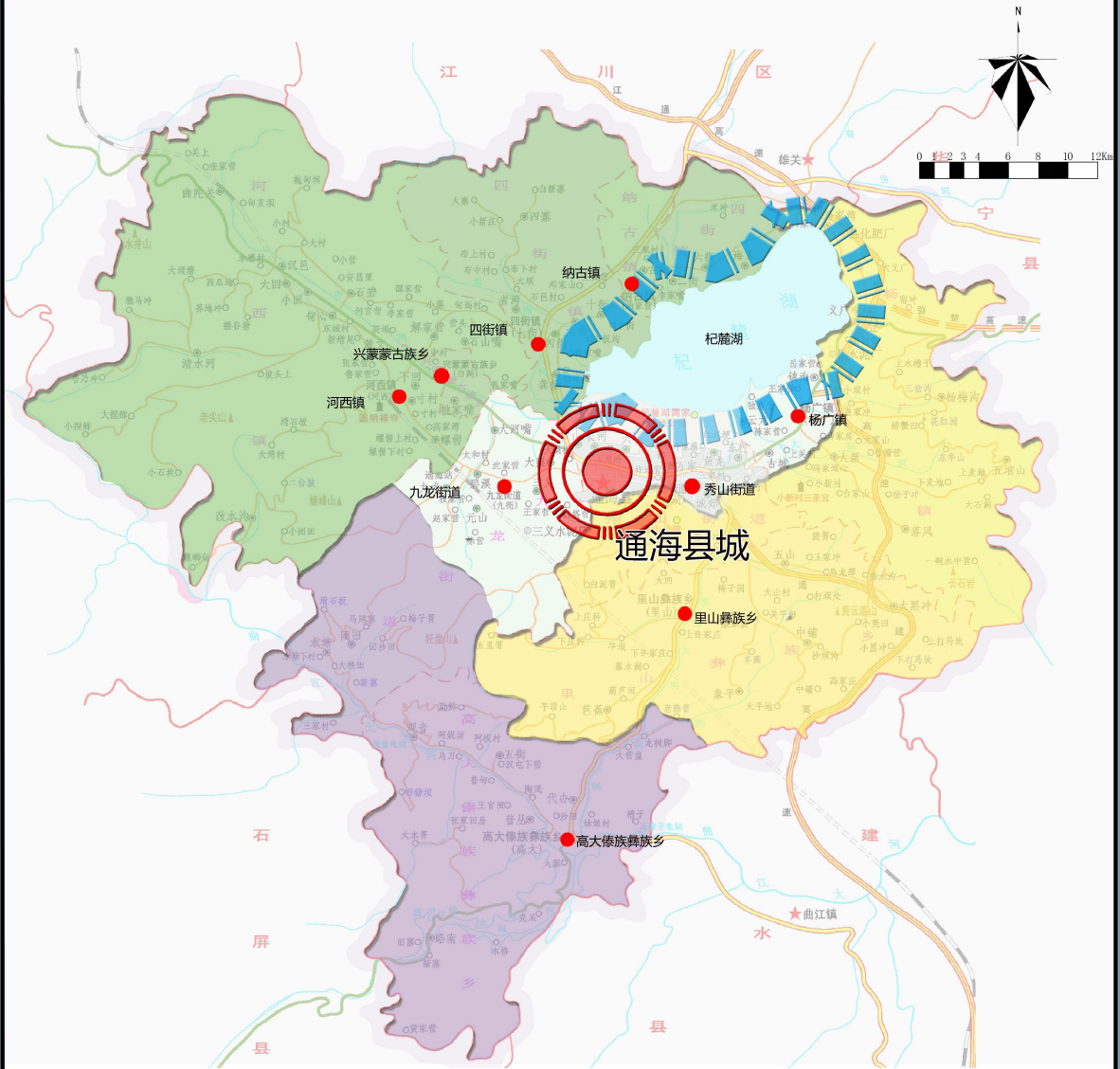
生产力空间布局图